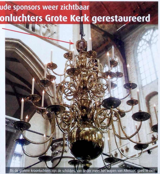
Bij de grotere kroonluchters zijn de schildjes, van onder meer het wapen van Alkmaar, goed te zien

Op de vier grootste kroonluchters in de Grote Kerk, die vervaardigd zijn in 1642, zijn de schildjes met de wapens van de financier